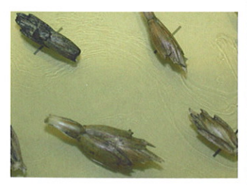
Måske er speltens avner med til at beskytte mod dannelse af OTA.

Man ved fra både danske og udenlandske undersøgelser, at forekomsten af Fusarium toksinet deoxynivalenol (DON) varierer meget fra sort til sort. En svensk undersøgelse tyder på en tilsvarende sortsvariation i OTA-produktion i både byg og hvede, men spørgsmålet er ikke særligt grundigt undersøgt, slet ikke for rug og spelt.