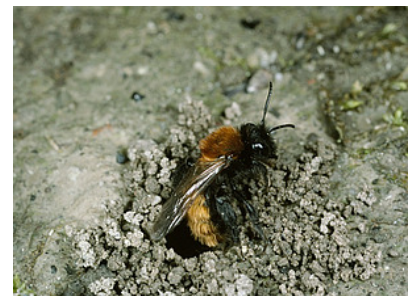
Sandbienen, wie hier die Rotpelzige Sandbiene ( Andrena fulva ) nisten im Boden an gut besonnten, offenen Bodenstellen. Als Nahrungsquellen fliegt sie Blüten von verschiedenen Pflanzen an. Jedoch hat sie eine Vorliebe für Blüten von Beerensträuchern.