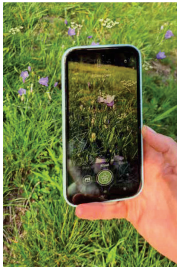
Aides au quotidien: des applis pour déterminer les plantes.

Texte: Sabine Reinecke et Rebekka Frick, FiBL