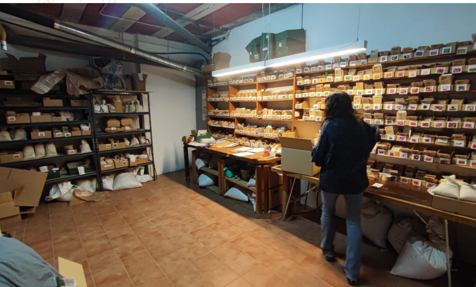
Preparació de les comandes