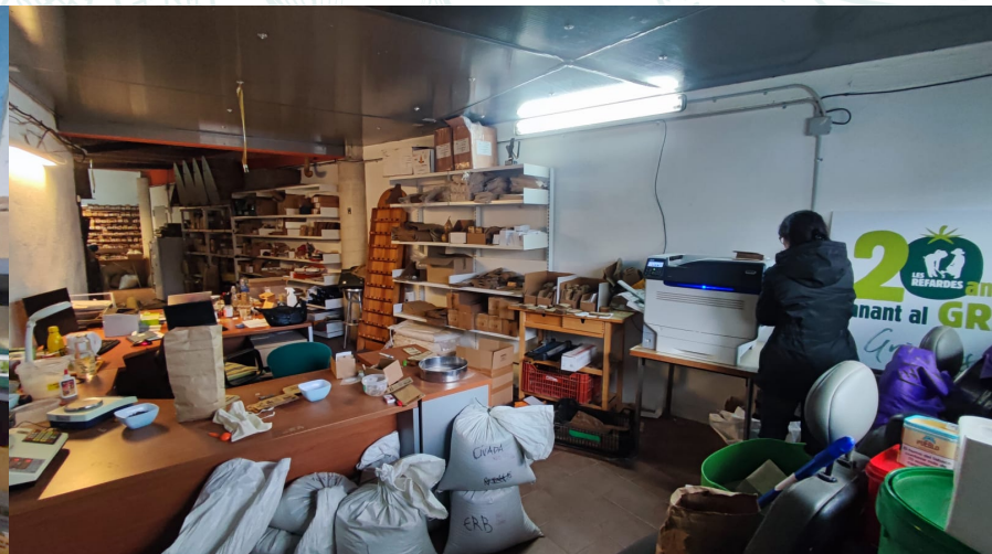
Impressió dels sobrets de les varietats