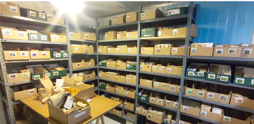
Càmera per guardar llavors