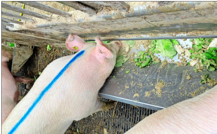
Salat ist bei den «Gemüseschweinen» hoch im Kurs.

Die Anwendung dieses Fütterungskonzepts resultiert daher in einer längeren Mastdauer, wenn man ein ähnliches Schlachtkörpergewicht