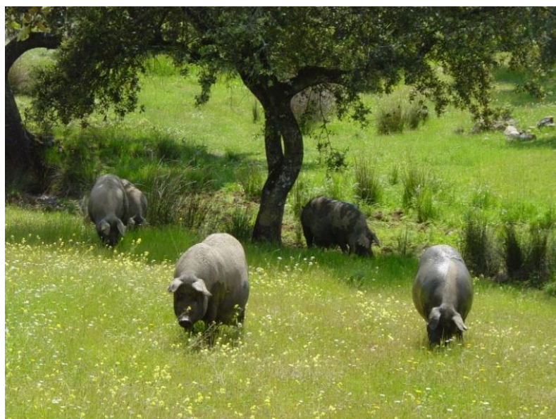
Rysunek 3: W przypadku ras rodzimych ważne jest, aby wybierać osobniki o odpowiednich umiejętnościach pasterskich (ciężarne lochy iberyjskie żerujące w systemie rolno-łesnym dehesa )

Należy pamiętać, że chociaż wielkość stada loch jest ważna, nie jest to czynnik najbardziej ograniczający. Najbardziej ograniczającym czynnikiem jest gromadzenie wiarygodnych informacji od momentu wprowadzenia loszki zastępczej do produkcji do oceny sensorycznej mięsa.