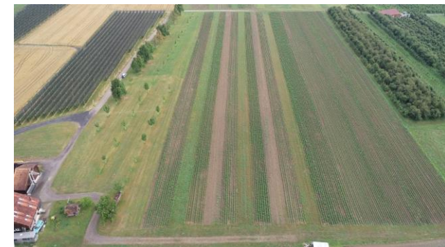
Kartoffel – Kunstwiese, 6 m