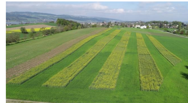
Raps – Triticale, 9 m