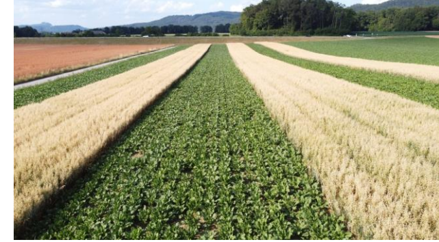
Zuckerrüben – Ackerbohne/Hafer, 9 m