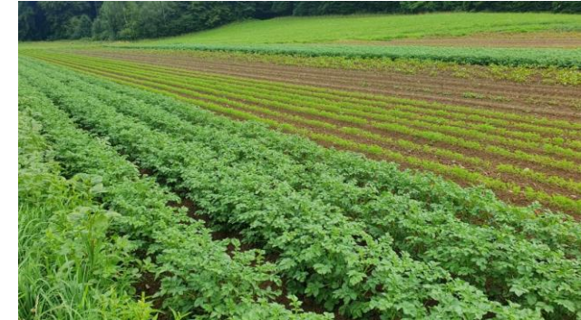
Kartoffel – Randen – Rüebli – Zwiebeln, 6 m