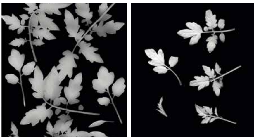
Abbildung 1: Die Fläche der vegetativen Teile in der 6. Woche des Keimlingsaufgangs bei Tomate der Landsorte Máriapócs. Links: Medium mit 100% Grünkompost, rechts: Medium mit 30 % Grünkompost.

Da der von uns gekaufte Grünkompost (aus einer Kompostieranlage) sehr vielversprechend war, wollten wir in der nächsten Phase prüfen, wie sich die Produkte der einzelnen Anlagen, die verschiedene Technologien verwenden, voneinander unterscheiden, d. h. ob wir eine gleichbleibende Qualität bei Grünkompost erwarten können. So haben wir neben dem bereits bewährten Kompost noch 4 weitere Produkte aus heimischen Kompostanlagen in unseren Versuch einbezogen, die