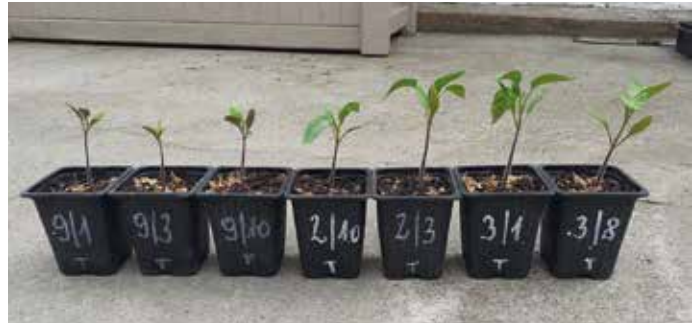
Abbildung 2: 3 Wochen alte Tomatenpflanzen der Landsorte Tóalmás in einem Boden mit 60 % Grünkompostgehalt. Die erste Zahl auf den Töpfen gibt die Herkunft des Grünkomposts an.

allgemeinen Zustand der Pflanzen deutlich verbesserte und ihre Entwicklung beschleunigte, hatten die Setzlinge, die in einem höheren Kompostgehalt und in besserem Qualitätskompost aufgewachsen waren, zum Zeitpunkt des Versuchsabschlusses in vielen Bereichen günstige Ergebnisse erzielt. Der durch Schädlinge und Krankheitserreger verursachte Stress (Zikaden-, Wanzen-, Thrips- und Raupenfraß sowie die durch Überträgerorganismen verursachte Stolbur in der Population) schwächte diese Individuen weniger, ihr Wachstum war stärker und ihr Zustand besser. Die Anzahl, das Gewicht, die Kategorie und die ernährungsphysiologischen Eigenschaften (pH-Wert, Zucker- und Säuregehalt) der von den Pflanzen geernteten Früchte wurden ebenfalls analysiert und werden derzeit noch ausgewertet, so dass diese Parameter zusätzliche nützliche Informationen liefern können.