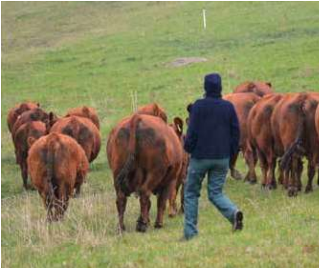
Eine Teilnehmerin treibt die Herde, indem sie im Zickzack hinter ihr läuft.

die Bedürfnisse des Tieres berücksichtigt. Da kann es reichen, beim Klauenschneiden dem Tier eine kurze Verschnaufpause zu geben oder es eine «Ehrenrunde» drehen oder lange schnuppeln zu lassen, bevor es in den Hänger steigt. Kühe sind sensible Lebewesen. Wenn wir Menschen sie nicht gut verstehen, dann scheinen sie uns oftmals dumm und störrisch. Wenn man sie aber verstehen lernt, kann man ein Gespür dafür entwickeln, welche menschlichen Ansprüche für die Tiere in Ordnung sind und kann ihnen ohne Stock und Schreien mitteilen, was man von ihnen will. Das ist entspannt, effizient und ganz ehrlich – irgendwie auch magisch. Eva Fölller, FiBL