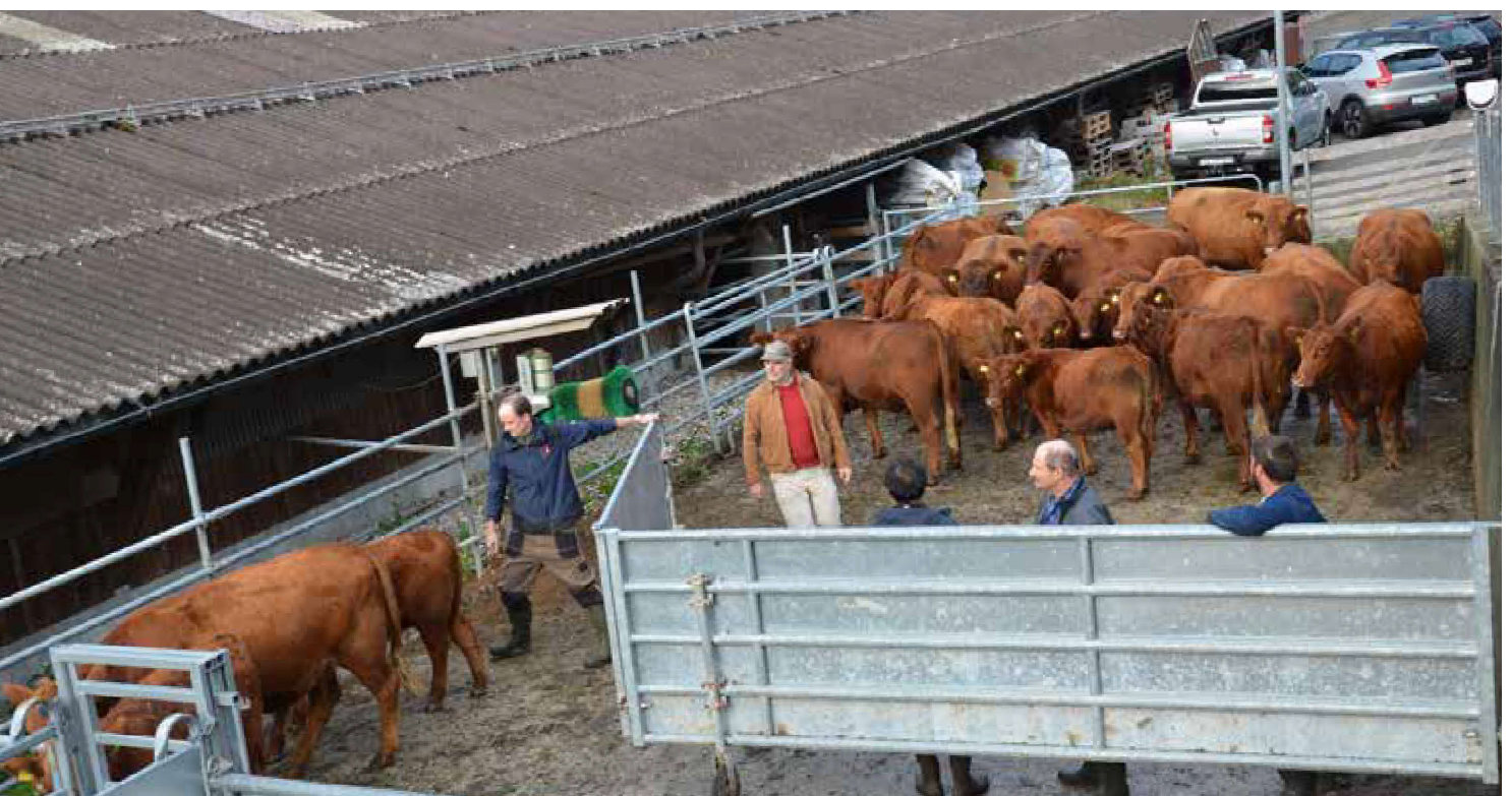
Die Kursteilnehmenden üben, die Tiere mit der «Bud Box» in den Treibgang zu bringen.