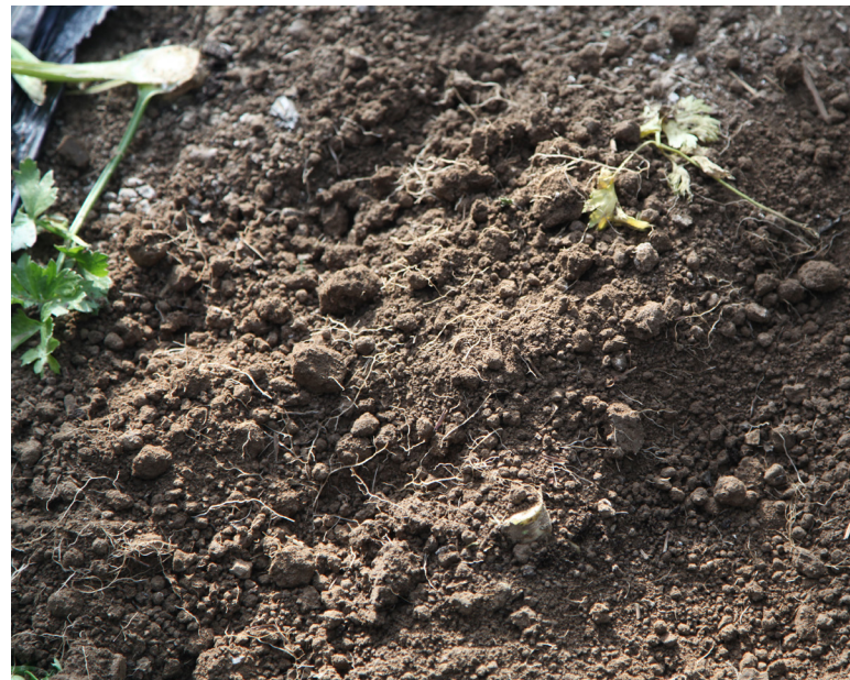
Bild 1: Bedömning av mikrolivet i marken: en fråga om syfte och skala

klimat och extrema händelser samt djupet och antalet av tagna jordprover. Det hade förstås varit utmärkt om man med hjälp av en enkel analys skulle kunna få svar på jordens mikroliv. Men samspelen är mycket invecklade. Därför behöver bedömningen bygga på fler olika mikrobiologiska, fysikaliska och kemiska parametrar som mäts på samma sätt under en lång tid (t.ex. 20 år). Central i dessa sammanhang är markens halt av organisk substans och dess omsättning. Detta sker i ett komplext nätverk ( näringsväv ) där mikroorganismer enbart är en grupp av organismer. EU lagstiftningen 2018/848's ambition förutsätter tillförlitliga datamodeller som vi hittills inte har. De stora framstegen på det molekylärbiologiska området under senare år har lett