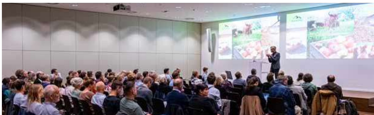
Evento dall'efficacia durevole: il tema centrale del vertice bio 2022 rimane delicato: «Bio sul mio piatto – vero o falso?»