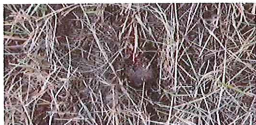
Figure 3. Reprise de la prairie sous une culture d'oignons, parcelle de BW ouest

La destruction d'une prairie n'est pas toujours une opération aisée. Pour les parcelles de Hainaut et BW ouest, la prairie a été mal détruite, ce qui a largement influencé les reliquats d'azote dans le profil cultural. La parcelle de BW ouest a fait l'objet d'un bâchage trop court, qui a permis la reprise du chiendent, graminée invasive particulièrement difficile à éradiquer (Fig. 3).