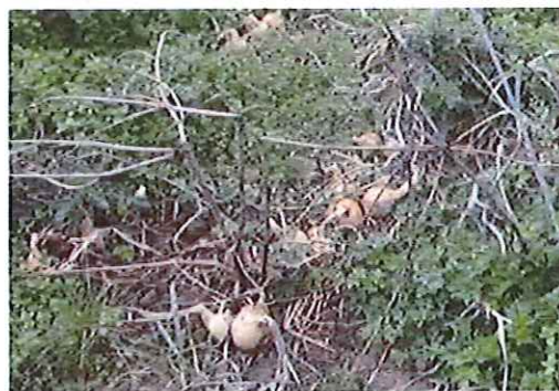
Figure 4. Culture d'oignons envahie d'adventices

ha), les poireaux et les oignons sont des cultures peu couvrantes qui favorisent le développement de ces indésirables (Figure 4). Les adventices peuvent jouer, en quelque sorte, un rôle de CIPAN, en participant au prélèvement du nitrate excédentaire et à sa restitution par décomposition. Mais elles sont évidemment déconseillées pour le bon développement des plantes cultivées.