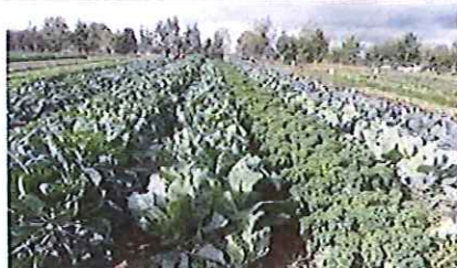
Figure 5. Exemple de culture de choux avec un haut potentiel de prélèvement des nitrates

Conformément à la littérature, cette étude confirme que la destruction d'une ancienne prairie permanente libère des quantités importantes d'azote (N) sous forme minérale. La première année suivant la destruction, la fourniture en N va être de l'ordre de 150 à 200 kg/ha, pour une prairie de fauche, et de 200 à 300 kg/ha, pour une prairie non fauchée sans apports extérieurs en N. En cas de fumure minérale ou organique, ou d'une charge en bétail importante les années précédant la destruction, la fourniture peut aller jusqu'à 500 kg/ha. En raison de cet apport d'azote élevé, de nombreuses cultures suivies au cours de cette étude ont dépassé les seuils d'intervention APL, parfois largement pour certains légumes feuilles (laitues, poutier, mâche, cresson...) de faible enracinement et de cycle végétatif court. Au contraire, certaines cultures exigeantes en N, et récoltées tard (choux, courges, certains légumes racines), ont relativement bien appauvri le sol en N, en dessous des seuils d'intervention (Figure 5). L'implantation de cultures gourmandes en N et la couverture permanente des sols sont donc les principales lignes directrices d'une