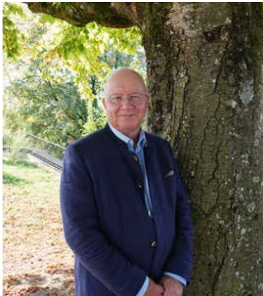
Il presidente del consiglio di fondazione FiBL Bernard Lehmann promuove la sostenibilità.

Come cittadino ritengo decisamente che dobbiamo ridurre drasticamente l'impiego di pesticidi. Questi prodotti hanno un impatto negativo sull'ambiente e sulla salute e fanno ammalare soprattutto coloro che li devono spargere sui campi. È chiaro che una strategia zero pesticidi non può essere intro-