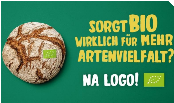
Abb. 1: Der Bericht unterstützt die Informationsoffensive des BMEL.