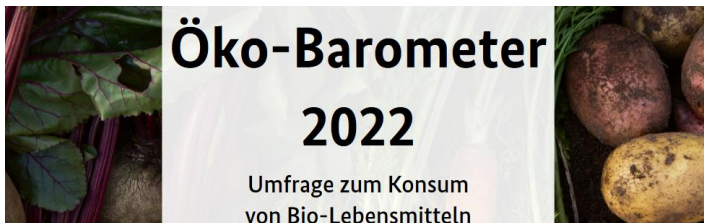
Abb. 4: Befragungen belegen Informationsbedürfnisse.

Das hochpreisige Image von Bio-Lebensmitteln stimmt nur zum Teil, denn im Handel variieren die Preise für gleiche Artikel erheblich. Dass viele konventionelle Lebensmittel zu noch höheren Preisen erfolgreich verkauft werden, zeigt, dass in breiten Bevölkerungskreisen eine höhere Zahlungsbereitschaft für Bio-Lebensmittel vorhanden wäre.