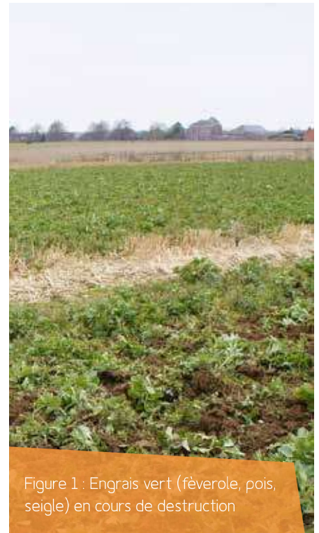
Figure 1 : Engrais vert (féverole, pois, seigle) en cours de destruction

À suivre dans le prochain Itinéraires BIO de juillet-août (disponible lors de la Foire de Libramont).