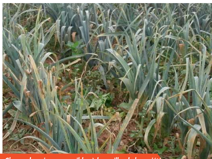
Champ de poireaux sensibles à la rouille, de la variété Sevilla, situé à 20 m du premier champ en 2015.