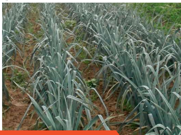
Champ de poireaux sains de la variété Curling.