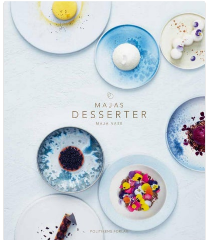
Den Lille Avis - Uge 36 - 2022 by denlilleavis2019