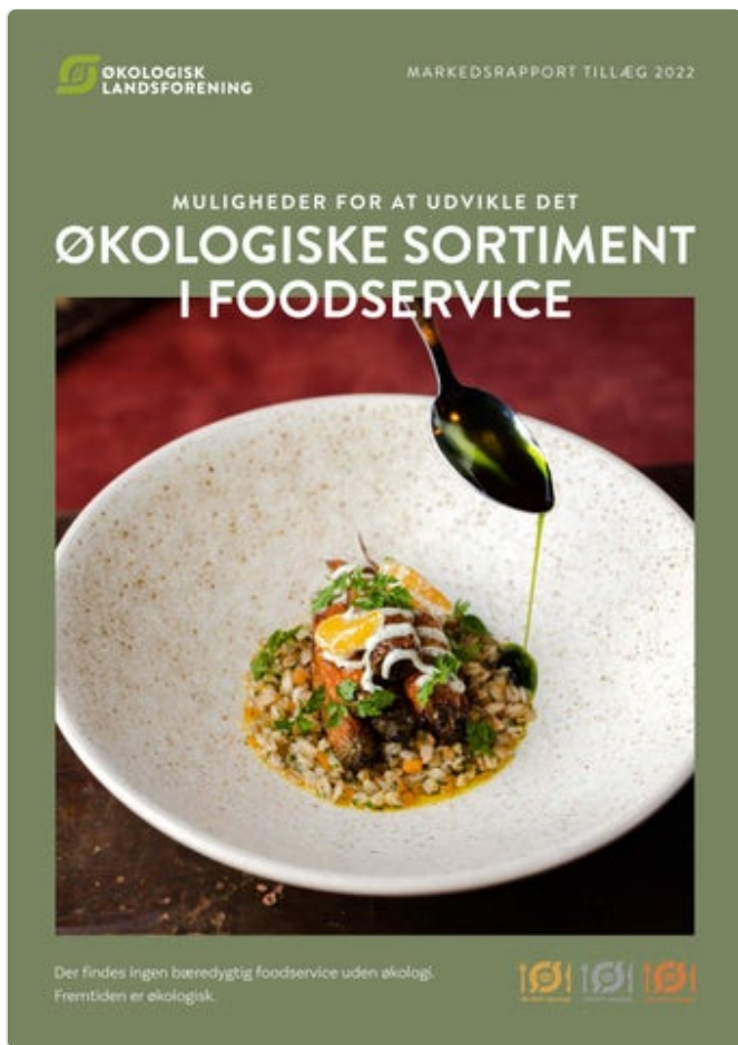
Det Økologiske Sortiment i Foodservice