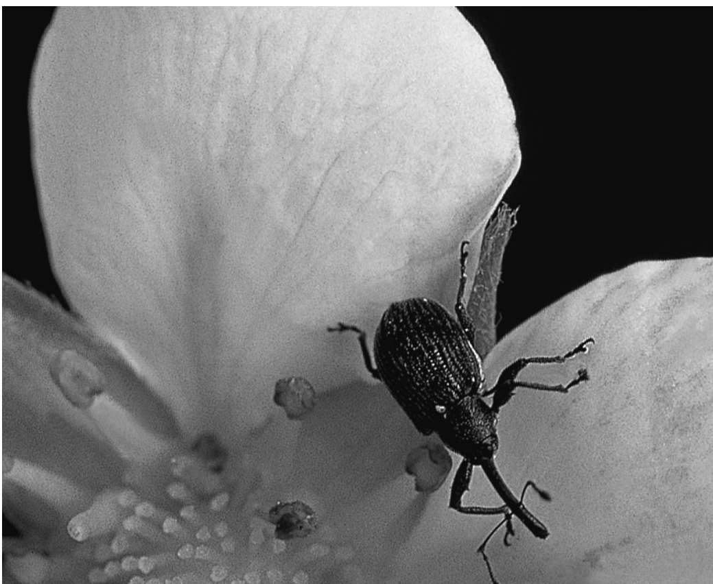
L'anthonome du pommier et les dégâts qu'il cause: les fleurs attaquées restent fermées puis se dessèchent.