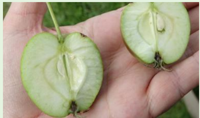
Abb. 2: Abgestoppter Befall