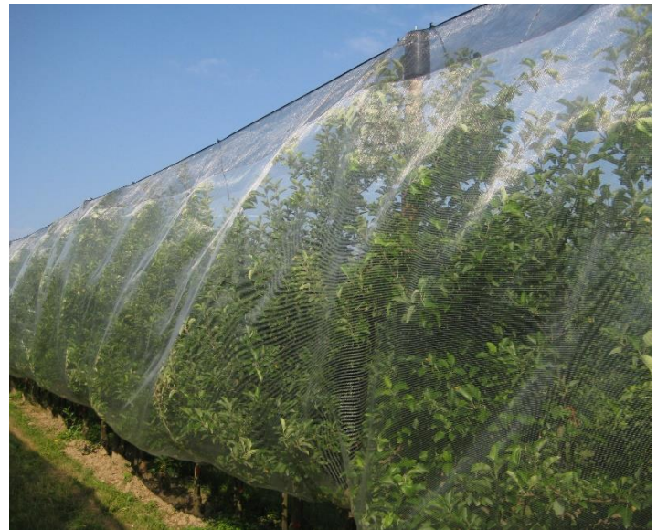
Abb. 3: Anlage mit „Keep in Touch“ Einnetzung am KOB Bavendorf