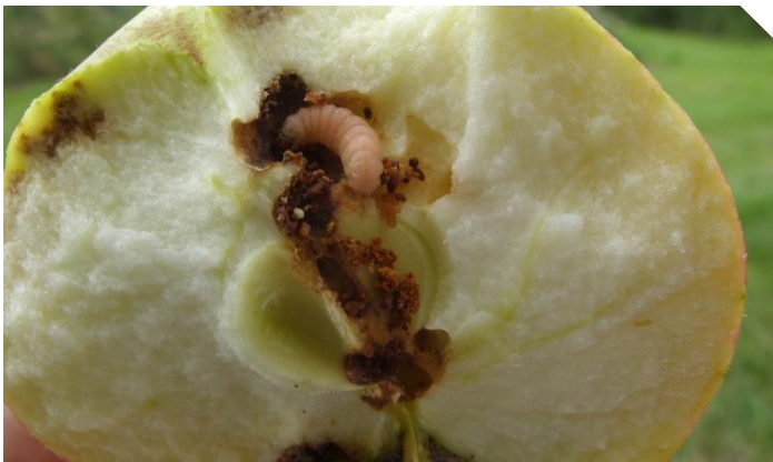
Abb. 1: Apfel mit Apfelwicklerbefall