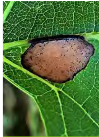
Pycnides dans la tache de black-rot.