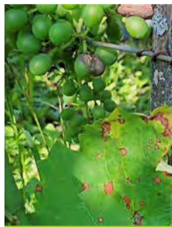
Black-rot sur feuille et sur baie.

Les inflorescences sont plus rarement attaquées. Ce sont surtout les symptômes sur baies qui sont problématiques. La baie touchée se décolore et se nécrose progressivement avec un liseré plus foncé sur le pourtour de la décoloration. Puis les baies sèchent et se momifient avec l'apparition de nombreux pycnides (points noirs), qui donnent un aspect rugueux à la baie. Les grappes peuvent entièrement dessécher en quelques jours, comme ce fut le cas sur certaines parcelles en 2021.