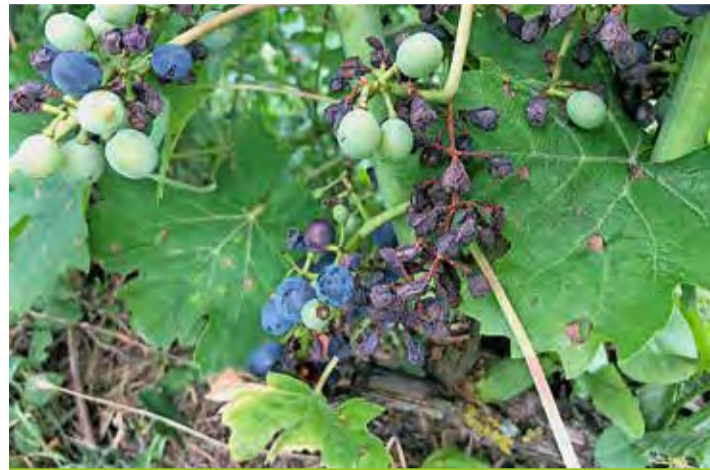
Dégâts importants de black-rot avec des baies momifiées.

Le black-rot est une maladie cryptogamique, comme le mildiou et l'oïdium, causé par le champignon Guignardia biduellii . Elle est également originaire d'Amérique du Nord. Les symptômes de black-rot sont de plus en plus fréquents en Suisse romande et ils sont facilement confondus avec d'autres maladies: dégâts de mildiou sur grappe ou expression des défenses naturelles sur des cépages résistants. En 2021, plusieurs parcelles de divico, cépage sensible à cette maladie, ont été totalement détruites par le black-rot alors que certains vigneron pensaient à tort, avoir subi des attaques de mildiou sur grappe. Le black-rot provoque sur les feuilles des petites taches bruns-rouge, de quelques mm à 1 cm, avec un liseré brun foncé noir sur le pourtour. Après quelques jours, des petits points noirs (pycnides = fructifications asexuées) peuvent apparaître sur la face supérieure des taches. Des nécroses (chancres) peuvent aussi s'observer sur le rameau herbacé, souvent en forme de losange.