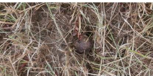
Figure 3. Reprise de la prairie sous une culture d'oignons, parcelle de BW ouest

La destruction d'une prairie n'est pas toujours une opération aisée. Pour les parcelles de Hainaut et BW ouest, la prairie a été mal détruite, ce qui a largement influencé les reliquats d'azote dans le profil cultural. La parcelle de BW ouest a fait l'objet d'un bâchage trop court, qui a permis la reprise du chiendent, graminée invasive particulièrement difficile à éradiquer (Fig. 3).