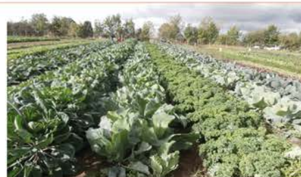
Figure 5. Exemple de culture de choux avec un haut potentiel de prélèvement des nitrates

Conformément à la littérature, cette étude confirme que la destruction d'une ancienne prairie permanente libère des quantités importantes d'azote (N) sous forme minérale. La première année suivant la destruction, la fourniture en N va être de l'ordre de 150 à 200 kg/ha, pour une prairie de fauche, et de 200 à 300 kg/ha, pour une prairie non fauchée sans apports extérieurs en N. En cas de fumure minérale ou organique, ou d'une charge en bétail importante les années précédant la destruction, la fourniture peut aller jusqu'à 500 kg/ha. En raison de cet apport d'azote élevé, de nombreuses cultures suivies au cours de cette étude ont dépassé les seuils d'intervention APL, parfois largement pour certains légumes feuilles (laitues, pourpier, mâche, cresson...) de faible enracinement et de cycle végétatif court. Au contraire, certaines cultures exigeantes en N, et récoltées tard (choux, courges, certains légumes racines), ont relativement bien appauvri le sol en N, en dessous des seuils d'intervention (Figure 5). L'implantation de cultures gourmandes en N et la couverture permanente des sols sont donc les principales lignes directrices d'une