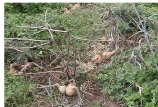
Figure 4. Culture d'oignons envahie d'adventices

ha), les poireaux et les oignons sont des cultures peu couvrantes qui favorisent le développement de ces indésirables (Figure 4). Les adventices peuvent jouer, en quelque sorte, un rôle de CIPAN, en participant au prélèvement du nitrate excédentaire et à sa restitution par décomposition. Mais elles sont évidemment déconseillées pour le bon développement des plantes cultivées.