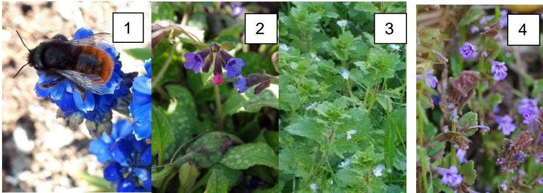
Gehörnte Mauerbiene auf Traubenhyazinthe (1). Lungenkraut (2). blühende Kräuter in der Obstanlage: Ackerehrenpreis (3) und Gundelrebe (4).