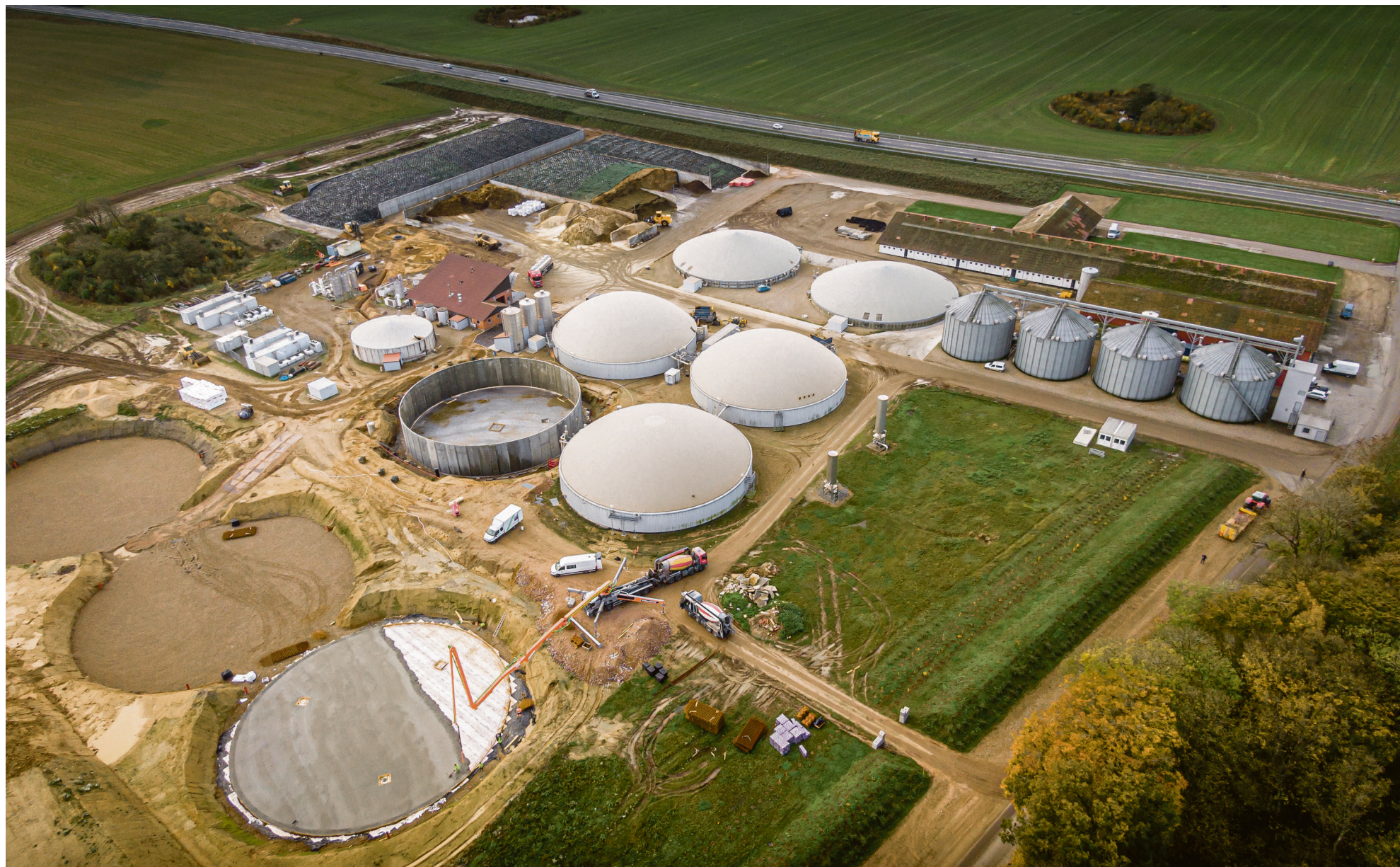
Det er muligt at lave økologisk startgødning ved at tage afgasset gødning fra et biogasanlæg og samle ammoniummet i en flydende fraktion, der kan nedfældes i starten af vækstsæsonen. Modellen er godkendt til økologisk jordbrug af Landbrugsstyrelsen.

Det ledes af Aarhus Universitet og gennemføres i samarbejde med SEGES og Innovationscentret for Økologisk Landbrug. Projektperioden løber fra 2019 til 2023.