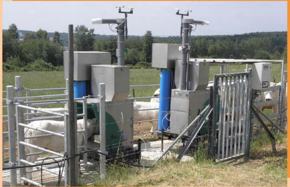
Figure 1. Deux appareils GreenFeed®s en vis-à-vis, permettant de mesurer les émissions de méthane des bovins par érucation. Ils sont ici installés en prairie à la station Haute-Belgique du CRA-W, à Libramont. L'appareil situé à gauche est accessible aux veaux uniquement.

La mesure des émissions de méthane via le GreenFeed® a l'avantage de permettre des mesures régulières des émissions de méthane sans impact sur la gestion du troupeau, à l'exception de la complémentation sous forme de concentrés. Pour l'ensemble des vaches, l'apport de concentrés via le GreenFeed représentait un total de 100 kg sur l'ensemble de la saison de pâturage, soit entre 8 et 9 kg par vache, ce qui est faible.