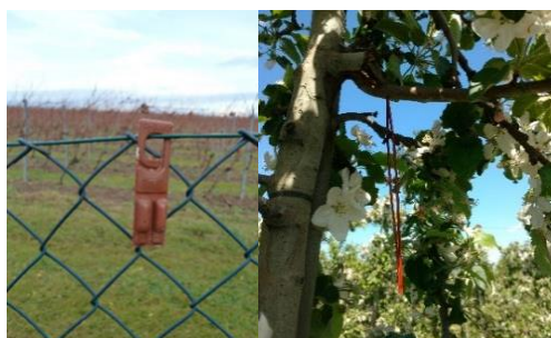
3. attēls. Dažādu veidu feromonu dozatori.