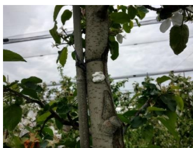
4. attēls. Cydia Pro Press plankums.