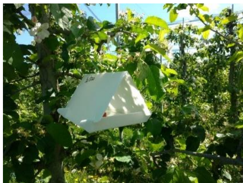
1. attēls. Trīsstūrveida slazds ābolu tinēja uzraudzībai.