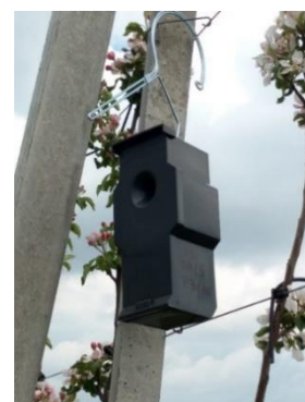
5. attēls. Smidzinātājs uz atbalsta staba.