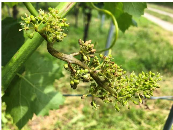
Traubenbefall durch Falschen Mehltau ist jetzt deutlich sichtbar und gut zu erkennen.

Botrytisinfektionen können bereits um die Blüte erstmals auftreten. Oftmals werden Infektionen nach der Blüte nicht sofort sichtbar oder mit Falschem Mehltau verwechselt. Vereinzelt ist Befall an jungen Trauben zu sehen, spezieller Handlungsbedarf besteht aber nicht.