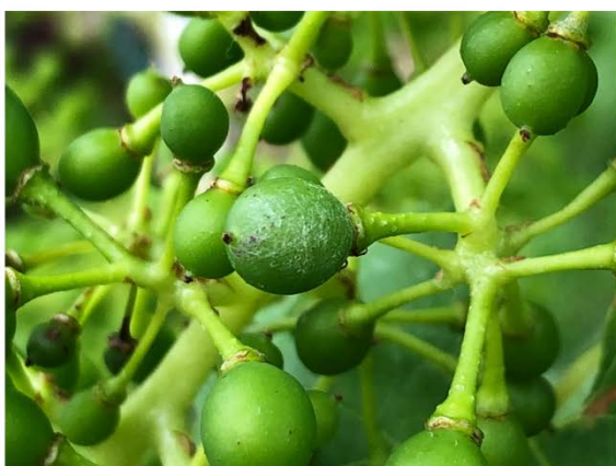
Echter Mehltau auf einer jungen Beere. Befall dieser Art ist nur durch aufmerksame Kontrollen zu finden.