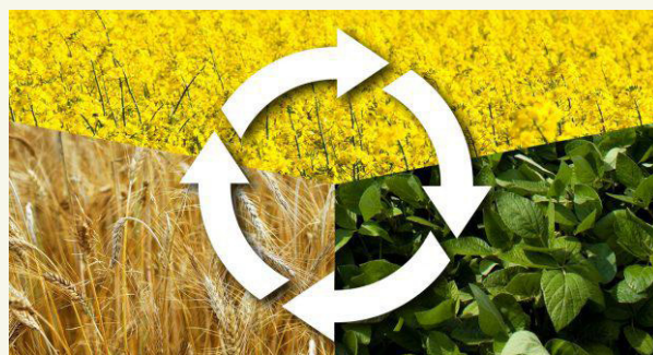
Imagem 1: Esquema de rotação de culturas. Culturas das diferentes famílias botânicas são cultivadas alternadamente.

A cada ano, é um desafio produzir culturas na quantidade necessária para garantir a rentabilidade da exploração, mantendo, ao mesmo tempo, a qualidade do solo para uma produtividade a longo prazo. Outro desafio é prevenir pragas e doenças específicas, sem promover outras pragas ou doenças ao planear a sequência de plantas hospedeiras e não hospedeiras. Nos parágrafos seguintes, aprenderá como o fazer, com exemplos de boas rotações de culturas.