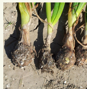
Imagem 2. Danos nas culturas por pragas e doenças: a) Fusarium em cebola (cebola do meio), b) Verticillium em morango, c) Rhizoctonia solani solani em alface, d) Sclerotium cepivorum em cebola.