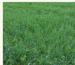
снимка 1: Тревно-бобовата смес може да се използва и за паша

Добре проучена група са смесите от треви и бобови растения (снимка 1). Такива смеси имат отлично разпределение на корените в почвата (снимка 2). Освен това смесите с пропорция от 40-60% бобови растения могат да увеличат фиксирането на азот чрез бобови култури в сравнение с чисти бобови растения (Nyfeler et al. 2011). Друго предимство на смесите от тревни и бобови растения е, че те могат да се използват и за паша, което ги прави интересни за региони със смесени земеделски системи, като обработваеми култури и млечно животновъдство. Особено през годините с по-екстремни климатични условия, такава „резервна“ тревна площ има висока стойност.