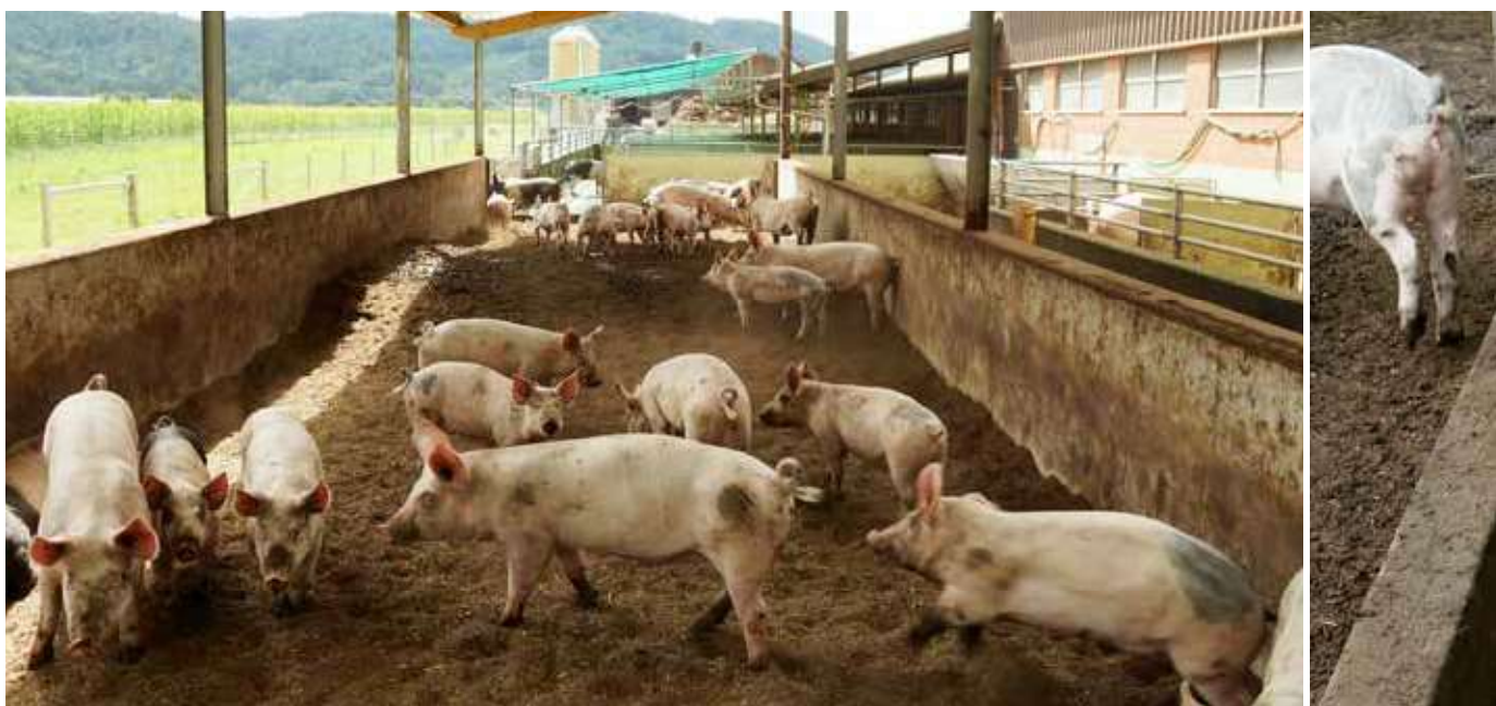
L'aire de fouissage est activement utilisée par les porcs à l'engraissement. Le toit protège de la pluie comme du soleil.

Il y a actuellement peu de dispositions concernant les aires de fouissage dans la production porcine Bourgeon. Une aire de fouissage ou un pâturage ne sont obligatoires que pour les truies tarées. Adrian Schlageter, chef de projet Bien-être ani-