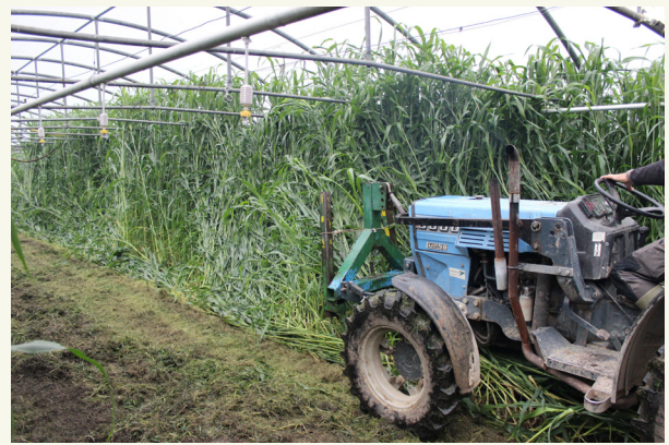
Abb. 3: Sorghum sudangrass ( S. bicolor x S. sudanense ) Gründüngung

Manchmal werden Gründüngungen oder Zwischenfrüchte nicht als wertvolle Kulturpflanze betrachtet, da sie keinen direkten Gewinn generieren und der indirekte Effekt nicht sofort sichtbar ist. Um jedoch einen positiven Effekt auf die Bodengesundheit zu erzielen, muss der Aufbau und das Wachstum der Pflanze erfolgreich sein. Dazu ist die Verwendung von gesundem Saatgut mit hoher Keimrate, guter Saatbettbereitung, Aussaat unter günstigen Bedingungen, mit ausreichenden Nährstoffen und gegebenenfalls Bewässerung erforderlich. Der Versuch Geld zu sparen indem man Mittel für eine solche Ernte reduziert, verschwendet Geld.