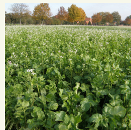
Fig. 1: Radis ( Raphanus sativus ) en couvert végétal.

sélectionnées sont capables de réduire les nématodes à kystes de la betterave ( Heterodera schachtii ) en interrompant la différenciation sexuelle dans le cycle de vie des nématodes. Différentes espèces d'œillet d'Inde ( Tagetes spp.) sont également connues pour leur effet suppressif sur certaines espèces de nématodes comme Pratylenchus penetrans (fig. 2) (Marahatta et al., 2012). Certaines variétés de radis sont capables de perturber la transmission du virus du bruissement du tabac, qui est à l'origine de la maladie des nécroses annulaires dans la pomme de terre et est transmis par les nématodes Trichodorus . Cet effet négatif sur les nématodes est également observé avec le virus du brunissement précoce du pois qui est lui aussi transmis par Trichodorus spp. La capacité des variétés de radis à réduire Meloidogyne ssp. est une caractéristique qui est de plus en plus intéressante. Comme le radis lui-même n'est qu'une plante hôte très pauvre pour cet important nématode, des variétés résistantes sélectionnées inhibent le cycle de vie de Meloidogyne et réduisent ainsi la population. Un troisième groupe de couverts végétaux résistants à différents nématodes est le sorgho ( Sorghum bicolor ) et le sorgho fourrager ( S. bicolor x S. sudanense ) (fig. 3) (Dover et al., 2012). Ce groupe est plus adapté aux régions plus chaudes. Quel que soit le groupe, il existe des différences importantes dans le niveau de résistance aux nématodes entre les espèces et même entre les cul-