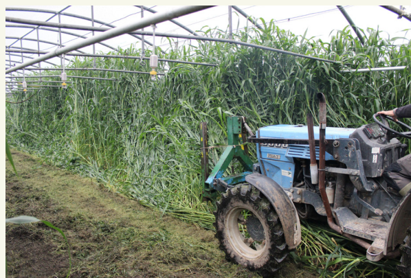
Fig. 3: Sorgho fourrager ( S. bicolor x S. sudanense ) en engrais vert (image de C. Wohler, Liebegg-Gränichen, Suisse).

Parfois, les engrais verts ou les couverts végétaux ne sont pas considérés comme une culture utile, car ils ne génèrent pas de profit direct et que leur effet n'est pas immédiatement visible. Mais pour obtenir un effet positif sur la santé du sol, la mise en place et la croissance de la culture doivent réussir. Par conséquent, il est important d'utiliser des semences saines avec un taux de germination élevé, de bien préparer le lit de semences, de semer dans de bonnes conditions, en apportant suffisamment d'éléments nutritifs et, si nécessaire, en irrigant. Tenter de faire des économies en réduisant les intrants sur une telle culture serait gaspiller de l'argent.