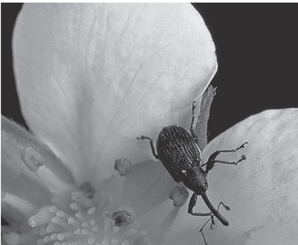
L'anthonome du pommier et les dégâts qu'il cause: les fleurs attaquées restent fermées puis se dessèchent.