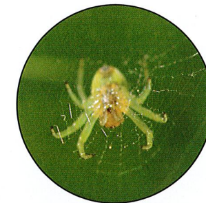
Spinnen ernähren sich alle räuberisch. Zu ihrer Beute gehören auch viele wichtige Schädlinge im Obstbau.