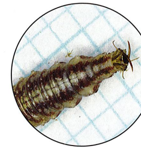
Florfliegen: Bis zu 500 Blattläuse frisst eine einzelne Larve, bevor sie sich in eine ausgewachsene Fliege verwandelt.

Durch die erwähnten schonenden Technologien kann der Einsatz von Insektiziden reduziert werden. Für manche Schädlinge stehen allerdings keine geeigneten Methoden zur Verfügung. Blattläuse zum Beispiel überwintern teilweise in Obstanlagen oder fliegen bereits Ende des Vorjahres in Obstanlagen ein – eine Volleinnetzung ist nicht wirksam, weil sie nicht ganzjährig