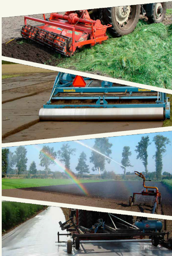
Fig. 1: Desinfección anaeróbica del suelo en un vistazo (de arriba a abajo): Incorporación de materia orgánica fresca Sellar la superficie Humedecer el suelo Cubrir con cubierta virtualmente impermeable (VIF)

La desinfección anaeróbica del suelo (DAS) es una alternativa a los tratamientos fumigantes químicos (fig. 1). La DAS reduce un elevado número de enfermedades edáficas, plagas y arvenses. El método requiere de la incorporación al suelo de material orgánico de fácil degradación, y posteriormente el suelo es cubierto con una lámina plástica hermética para evitar la entrada de oxígeno y crear un ambiente anaeróbico. Durante la degradación del material orgánico, los microorganismos consumen todo el oxígeno. Para algunos organismos, estas condiciones anaeróbicas por sí solas ya son letales. La materia orgánica (MO) se degrada aún más durante la fermentación, y se liberan ácidos grasos volátiles que son letales para muchas otras especies de organismos del suelo. Muchas especies útiles sobreviven tanto a la anaerobiosis como a los compuestos volátiles, por lo que no se trata de una esterilización del suelo.