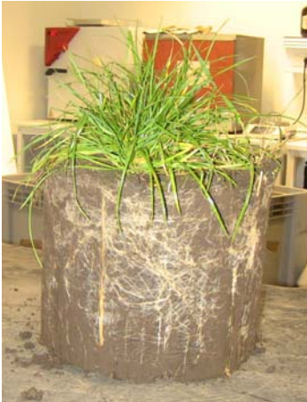
Figur 1: Udtagning af intakt jord-kerne med rajgræs i November 2020 (PVC cylinder til 20 cm dybde ses på figur 3).