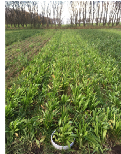
Figur 3: Lancetbladet vejbred som efterafgrøde i November 2020.

I samarbejde med AgrolIntelli udvikler vi et kamera-værktøj baseret på kunstig intelligens til bestemmelse af efterafgrødebiomassen, således at gødningseffekten af efterafgrøderne kan bestemmes og indgå i gødningsplanlægningen for den efterfølgende hovedafgrøde.