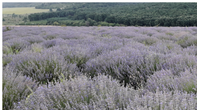
Ilustrația 6: Lavanda ecologică din Moldova în pregătire pentru certificarea Demeter (Arndt, 2019)