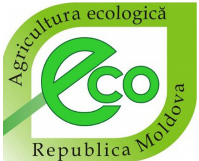
Ilustrația 3: Marca națională „Agricultura ecologică - Republica Moldova” (MADRM, 2010)

adoptată prin Legea nr. 26 of 24.02.2011 (↪) pentru a corespunde modificărilor reglementărilor UE.