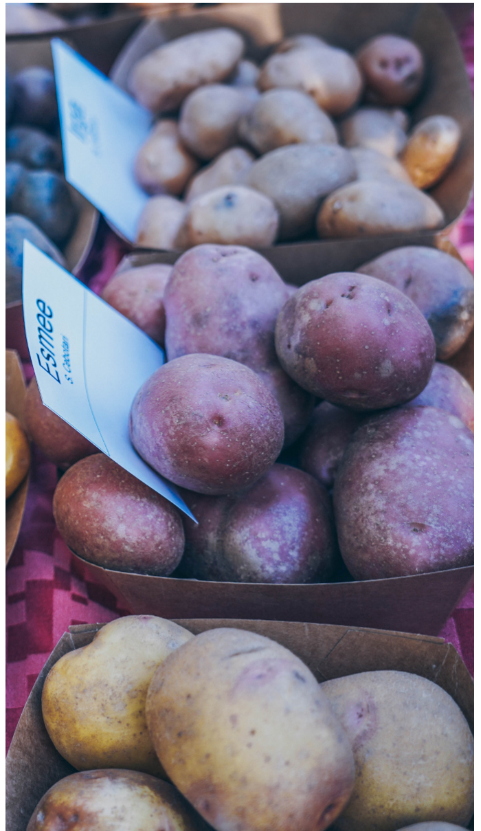
Ilustrația 4: Varietate de soiuri la festivalul cartofului Ecovisio (Ecovisio, 2020)

Unele organizații active în trecut (și menționate în raportul de țară EkoConnect din 2011) nu mai există, cum ar fi Asociația Națională a Fermierilor Ecologici (APEM-AGRO) sau ONG-ul ProRuralInvest.