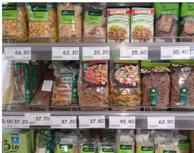
Ilustrația 8: Raft cu produse ecologice în supermarketul Nr1 (Arndt, 2020)