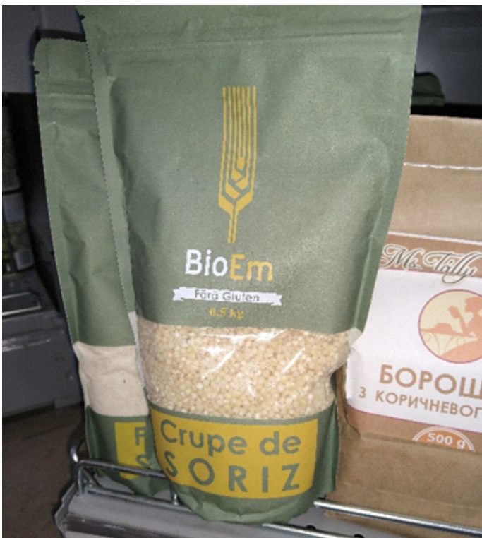
Ilustrația 2: Etichetarea înșelătoare nu este penalizată în Moldova (Arndt, 2020)

Cadrul legal inițial s-a bazat pe Regulamentul Consiliului UE 2092/91. Regulamentul tehnic „Producția agroalimentară ecologică și etichetarea produselor agroalimentare ecologice” HG nr. 1078 din 22.09.2008 (↪) adaugă câteva reguli noi, conform cerințelor legislației naționale. O modificare a Legii 115/2005 a fost