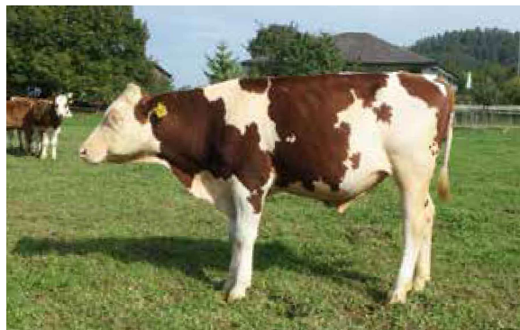
Kingboy, sélectionné par Daniel Siegenthaler.

Kingboy (CH 120.1389.4893.6) a été élevé par la famille Siegenthaler de la ferme «Hof im Bödeli» à Schangnau BE. Cette ferme, qui se trouve en zone de montagne 3 à 1200 mètres d'altitude au pied du Hohgant, est la plus élevée de Schangnau à être utilisée toute l'année. La famille Siegenthaler respecte le Cahier des charges de Bio Suisse depuis 1994. Les 24 vaches laitières pâturent beaucoup, ne reçoivent qu'un minimum de concentrés et ont très rarement besoin d'antibiotiques. Kingboy présente grâce à ses valeurs d'élevage de bonnes pré-