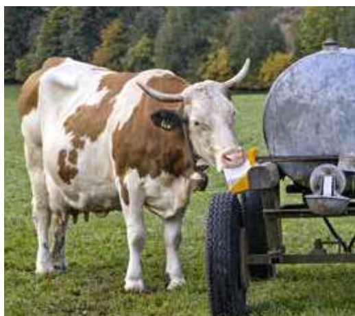
I mangimi bioconformi contribuiscono all'elevato benessere degli animali.

Per l'inserimento di nuovi prodotti nell'elenco dei fattori di produzione è responsabile il gruppo mangimi del FiBL incaricato da Bio Suisse che accetta volentieri riscontri relativi ai mangimi o a prodotti mancanti per determinati ambiti d'utilizzo. Il gruppo è in contatto con i produttori e si impegna a trovare nuovi prodotti bioconformi. In caso di prodotti non ancora disponibili si raccomanda di affrontare la questione direttamente con i produttori di minerali.