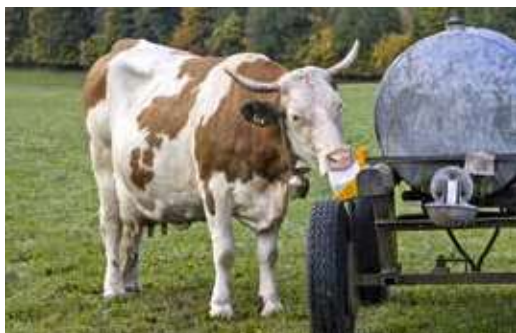
Les minéraux bioconformes contribuent au bien-être des animaux.

L'enregistrement de nouveaux produits dans la LI est fait sur mandat de Bio Suisse par le FiBL, qui notera volontiers les avis au sujet des aliments fourragers ou les lacunes concernant certains domaines d'utilisation. L'équipe est en contact avec les fabricants et elle essaie de trouver de nouveaux produits bioconformes. Il est en outre recommandé d'interpeller directement les fabricants de minéraux au sujet des lacunes afin qu'ils puissent prendre conscience des besoins.