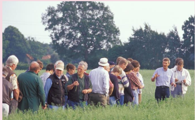
Abb. 2: Kollegialer Austausch