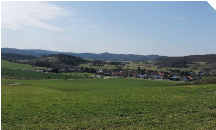
Abb. 1: Dorf in Nordhessen