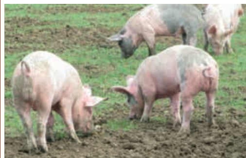
Unter extensiven Fütterungsbedingungen ist aufgrund der längeren Mastdauer mit mehr geruchsauffälligen Schlachtkörpern zu rechnen.

Für die Produktion von regionalen Spezialitäten werden oft sehr schwere Tiere mit über 200 kg Lebendgewicht verwendet. Da die bisherigen Erfahrungen mit leichteren Tieren gemacht wurden, besteht für diese Nische noch viel Forschungsbedarf. In Spanien und Portugal werden die männlichen Tiere für diese schweren Kategorien immer kastriert. Gerade in der Bioproduktion gibt es einige extensive Nischen wie die Haltung der Schweine auf der Weide oder als Restenverwerter. In solchen Produktionsformen werden wesentlich geringere Tageszunahmen erreicht, dafür aber etwas höhere Gewichte angestrebt. Nach bisherigen Kenntnissen ist bei extensiver Ebermast mit vielen geruchsauffälligen Schlachtkörpern zu rechnen. Die Immunokastration oder die chirurgische Kastration mit Betäubung könnten für diese Mastformen die geeigneteren Methoden sein.