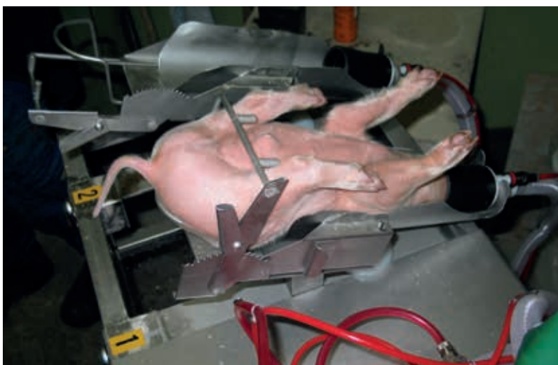
Die Kastration unter Narkose oder Betäubung ist zeitaufwändig und besonders für kleinere Betriebe kostenintensiv. Es ist ein Fortschritt im Vergleich zur betäubungslosen Kastration, bleibt aber ein Eingriff, der mit Stress und Schmerzen für das Tier verbunden ist.

Die Kastration ist ein gravierender Eingriff am gesunden Tier und für die Ferkel sehr schmerzhaft, wie Untersuchungen belegen. Während konventionell gehaltene Ferkel in den meisten Ländern Europas noch ohne Betäubung kastriert werden, sind Narkose oder Betäubung zur Schmerzausschaltung während des Eingriffs und/oder die Verabreichung eines Schmerzmittels für Biobetriebe vorgeschrie-