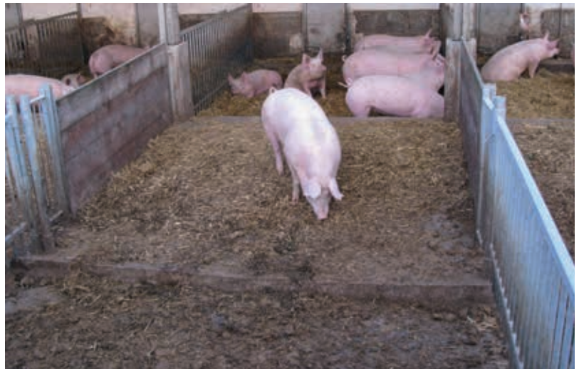
Eine gute Strukturierung der Bucht mit verschiedenen Funktionsbereichen bietet schwächeren Tieren Ausweichmöglichkeiten.