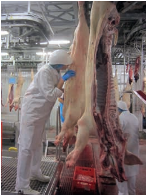
Die Geruchsprobe erfordert eine sensible Nase und einige Erfahrung. Idealerweise wird die Probe von zwei oder drei geschulten Prüfern durchgeführt.

Offizielle Grenzwerte, die besagen, ab wann das Fleisch von den Verbrauchern abgelehnt wird, existieren nicht. Trotzdem werden für Messungen 500 oder 1.000 ng/g Androstenon und 250 ng/g Skatol pro Gramm Fett häufig als Grenzwerte verwendet. Die Interaktionen zwischen diesen beiden Substanzen und weiteren Komponenten machen die Beurteilung des Ebergeruchs jedoch schwierig.