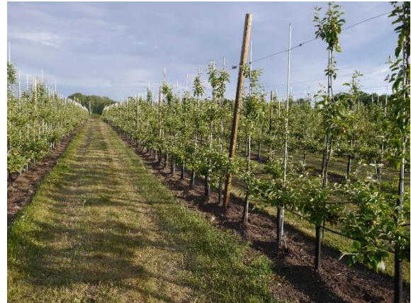
Bilde fra en ung økologisk tettplanting i Østfold, hvor ugraset er under kontroll og gjødsla er moldet ned. Dryppvanningsslangene er montert høyt for å unngå skade fra maskinelt ugrasutstyr.

Debio har også laget noen enklere introduksjoner til regelverket for økologisk landbruk, som kan leses her .