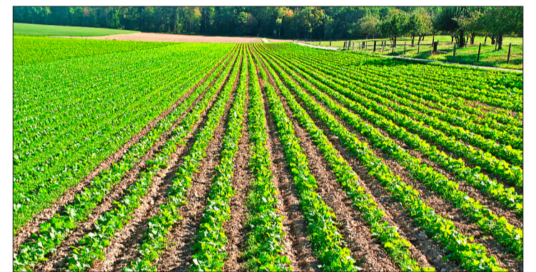
So sieht Bioraps im Idealfall Ende September aus.

Tobias Gelencsér Hansueli Dierauer, FiBL