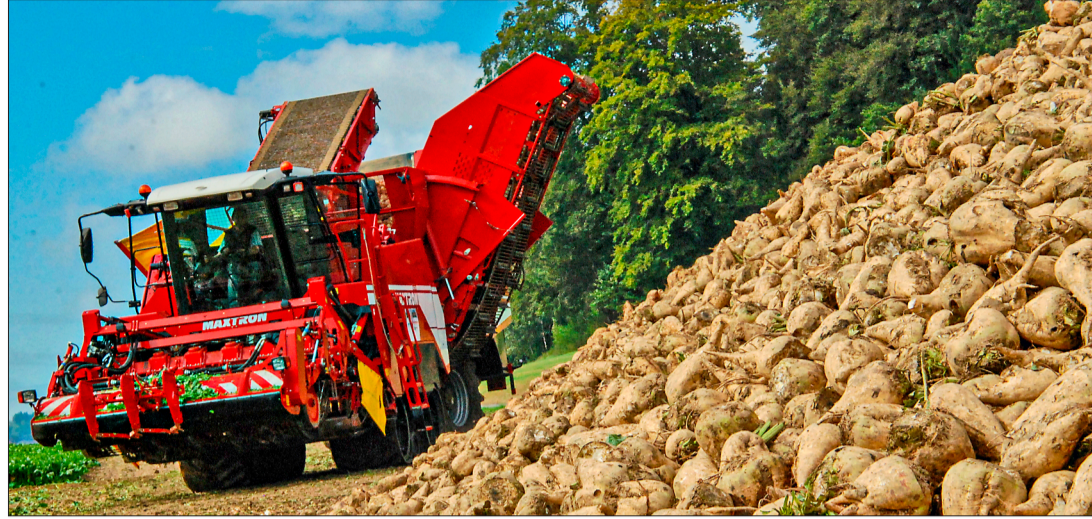
Gerade bei der beginnenden Rübenernte lasten grosse Gewichte auf dem Boden.

• Gerste: Seit Anfang 2019 ist die Verwendung von insektiziden Beizmitteln in Gerste und anderen Getreidearten verboten. Die Saatgutbeizung mit einem Insektizid in der Gerste wurde vor allem wegen den virusübertragenden Blattläusen durchgeführt. Mit dem Wegfall der Beizung ist ein vermehrtes Auftreten des Gelbverzwergungsvirus möglich, doch nicht zwingend. Das Gelbverzwergungsvirus führt dazu, dass die Pflanzen im Wachstum zurückbleiben und manchmal ganz absterben. Mit relativ einfachen Massnahmen kann die Infektion verhindert werden: Die Gerste sollte so spät wie möglich, also Anfang bis Mitte Oktober, gesät werden. So fällt der Blattlausflug und das empfindliche Stadium der Gerste nicht in den gleichen Zeitraum. Ein milder Herbst und ein rasches Auflaufen begünstigt die Infektion. • Grünland: Vereinzelte Blacken kann man das ganze Jahr von Hand ausstechen. Hat es zu viele Blacken, bietet sich die chemische Variante an. Der optimale Termin der Bekämpfung ist bis Ende September, da die Blacken in dieser Zeit den Wirkstoff optimal in die Wurzel hinuntertransportieren. Mit dem Mittel Ally Tabs werden