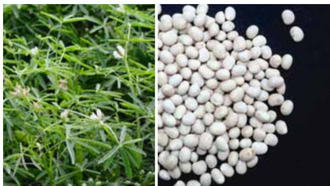
Schmalblättrige Lupinen eignen sich für den Anbau in Rein- und Mischkultur. Die Samen sind kugelförmig.