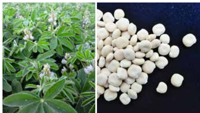
Weisse Lupinen eignen sich für den Anbau in Reinkultur. Die Samen sind flache Scheiben.

darfsgerecht produziert werden kann.» Da die Forschenden noch keinen Mischungspartner gefunden haben, der gegenüber der Reinkultur besser wäre, muss jedoch leider noch mit Spätverunkrautung aufgrund der langen Reifezeit der Weissen Lupine bis mindestens Mitte August gerechnet werden.