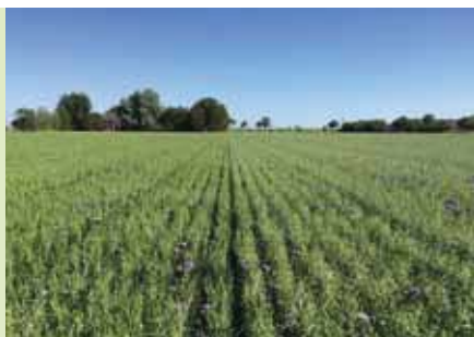
Haver met klavers en facelia

Aanvankelijk werden de klavers gemaaid en het maaisel werd als maaimeststof op een ander perceel uitgebracht. "We kwamen er echter vrij snel achter dat dat helemaal niet nodig is, als we er voor zorgen dat er na én voor een gewas altijd een groenbemester staat." Deze groenbemesters vullen alle 'lege' plekken in het bouwplan op. De mengsels bestaan uit minimaal 10 verschillende plantensoorten in verschillende samen-