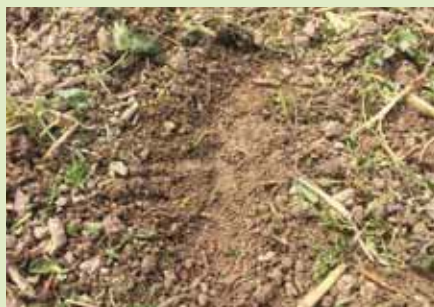
Mosterd gezaaid in 2 cm diep ingewerkte klaver

Bedrijfsomvang: 117 ha, waarvan 30 ha kwelder Grondsoort: 10-40% slib