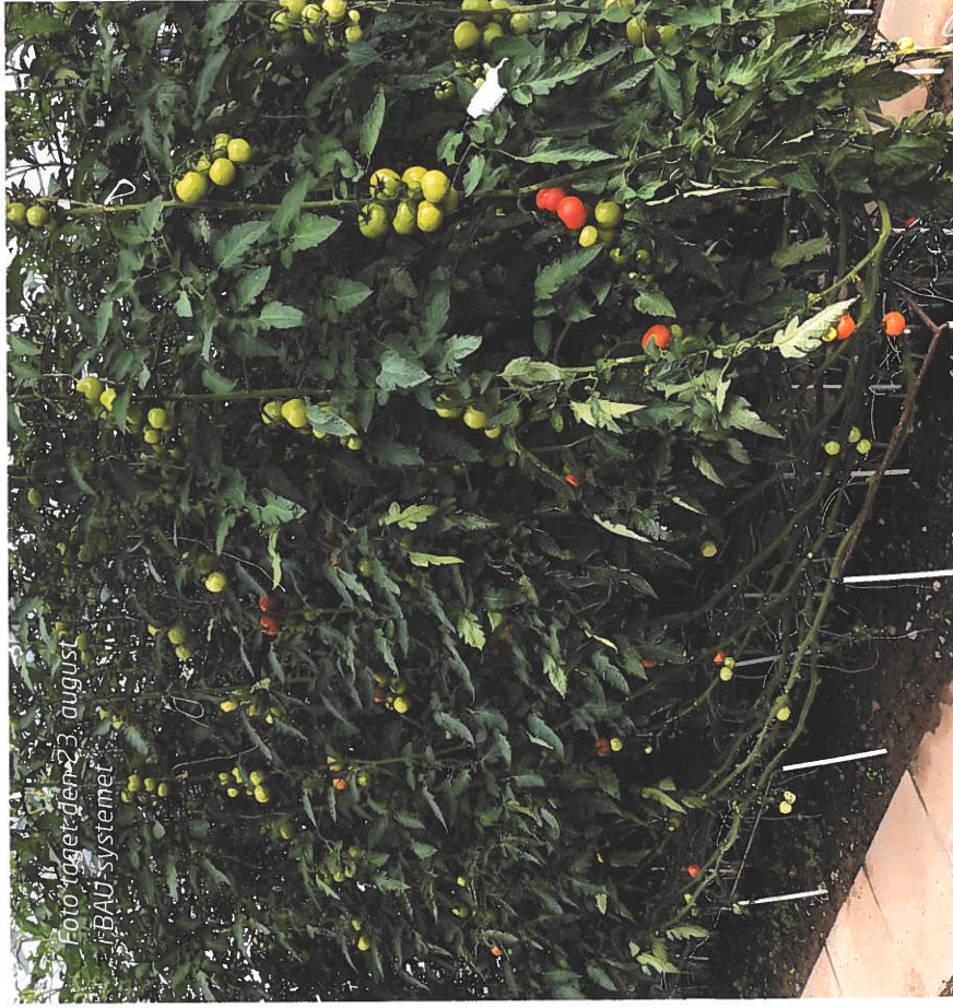
Foto taget den 23. august i BAU-systemet