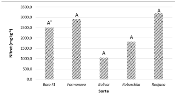
Abbildung 1: Nitratgehalt (mg kg -1 ) der offen abblühenden Rote Bete Sorten und der Hybride F1 (Versuchsjahr 2017, Kleinhohenheim). *Unterschiedliche Großbuchstaben zeigen signifikante Unterschiede zwischen den Sorten ( p < 0,05 ).

Die Sorte Ronjana hatte mit 3206 mg kg -1 Nitrat in der Frischmasse (FM) beziehungsweise 15,59 mg g -1 Betalain in der Trockenmasse (TM) die höchsten Werte der fünf verglichenen Sorten (Abb. 1, 2). Die niedrigsten Nitrat-Gehalte mit 1049 mg kg -1 wies die Sorte Bolivar auf. Die geringsten Betalain-Gehalte wurden in den Proben der Sorte Formanova gefunden (10,09 mg g -1 TM).