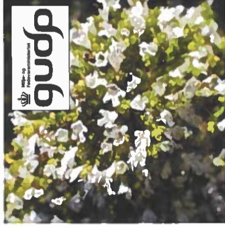
Origanum vulgare ssp. hirtum har hvide blomster og et højt indhold af æterisk olie.

I 2016 blev frø af ni frøklider af oregano af typen Origanum vulgare ssp. hirtum også kaldet 'græsk oregano' indkøbt fra Danmark, Tyskland og Canada. I forbindelse med det såkaldte MET-ANO-projekt om at fodre økologiske malkekøer med stærk oregano for at nedsætte udledning af metan blev frøklider af oregano afprøvet ved henholdsvis AU Food Årslev og af Nissen Consult. Oregano til køer virkede desværre ikke på metanudledning, men resultaterne af afprøvningen er interessante for dyrkning som krydderurter og for produktion af æterisk olie.