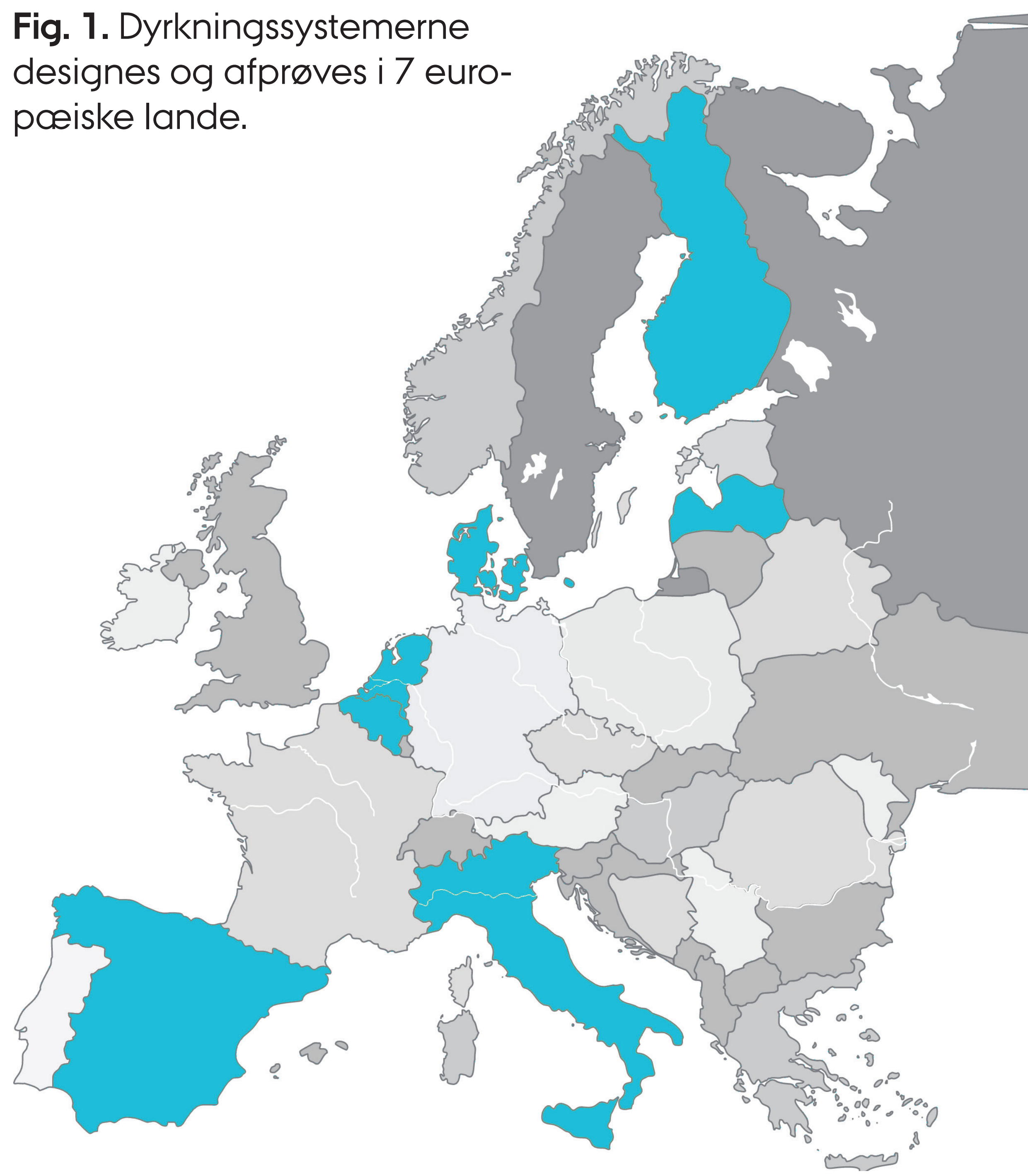
Fig. 1. Dyrkningssystemerne designs og afprøves i 7 europæiske lande.