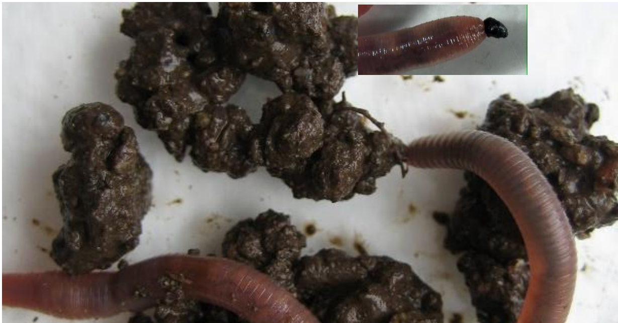
Gråmeitemark er den vanligste arten meitemark i norsk dyrka jord. All jord på bildet er ekskrementer (kast) fra gråmeitemark og er bidrag til grynstruktur i jorda sin totale struktur.

En del av næringa i jord og planterester som meitemark eter går til egen vekst. Resten skiller de ut som kast, urin og slim. I en svensk undersøkelse i ugjødsla byggåker produserte meitemarkene i jorda, mest gråmeitemark, fire tonn ekskrementer per dekar og år, mens i en næringsrik luserneeng var mengden hele 100 tonn (Bostöm, 1988). Vi har også studert dette i jord med kulturvekster av havre og erter. Vi beregnet at med 229 meitemark/m 2 , mest gråmeitemark, ble det produsert ekskrementer tilsvarende 20 tonn pr år og dekar, eller 20 kg/m 2 (Pommeresche og Løes 2009).